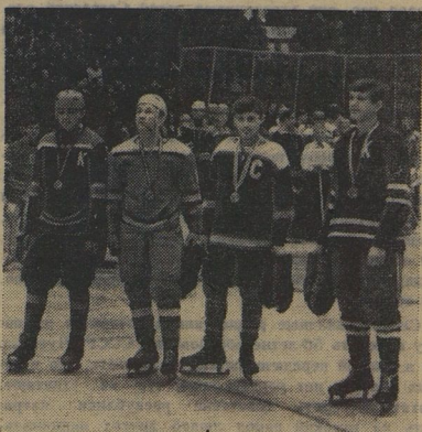
Четыре капитана... Они самые счастливые капитаны, потому что уверенно прошли курсом побед к главным призам «Золотой шайбы».